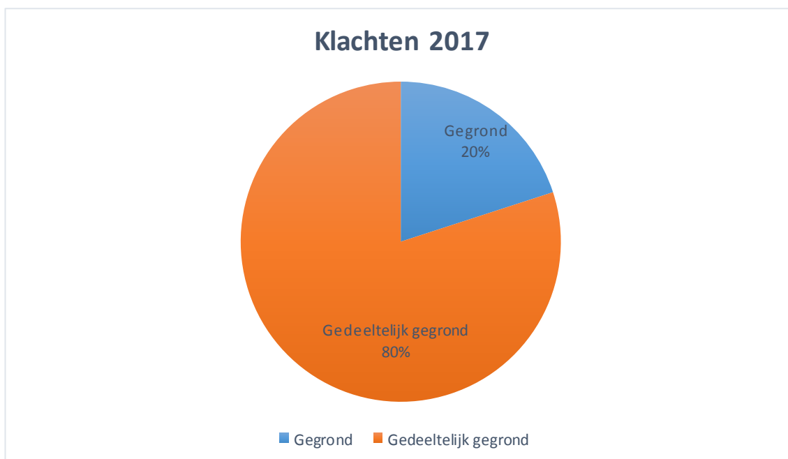
Afbeelding 2: verdeling van adviezen van de Geschillencommissie